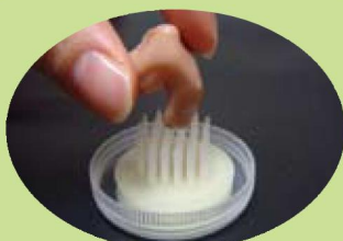
補聴器掃除用ブラシ ¥525(税込)

補聴器の掃除に使うブラシは、各家庭にある歯ブラシでもOKだが、ここでは、机の上に置いて使用するタイプの専用ブラシを紹介しよう。これなら、ブラッシングする時に音口が必ず下を向くから、汚れが補聴器の中に入りやすく安心。是非、使ってみてくれ!