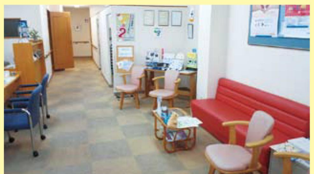
清潔感あふれる新津店 店内

新津店は、新津新光商店街にあります。商店街では季節ごとにいろいろなイベントがあり、楽しくお買い物ができます。そして毎月1の付く日には、駅前に市場がでて賑わいます。ぜひ、新津散策の帰りにでも寄ってみてください。広い店内でゆっくりとお茶でもいかがですか。